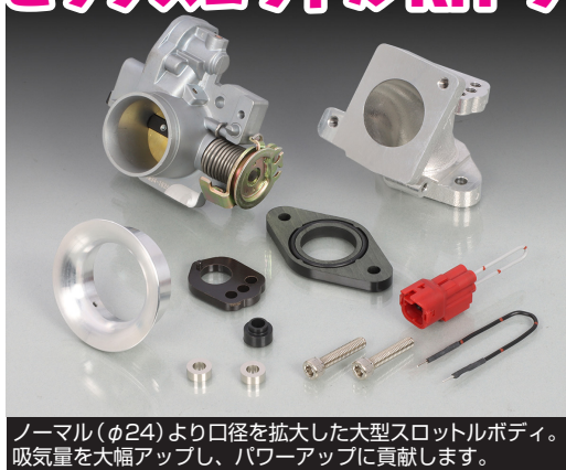
ノーマル(φ24)より口径を拡大した大型スロットルボディ。吸気量を大幅アップし、パワーアップに貢献します。